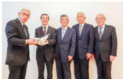
岐阜県退職公務員連盟山県支部