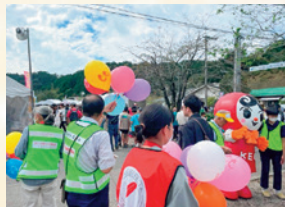
栗まつりでは民生児童委員協議会のみなさまと街頭募金活動を行いました!!