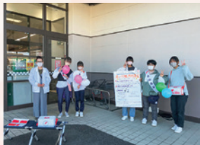
市内の商業施設では子どもボランティアクラブが街頭募金活動に参加しました!!