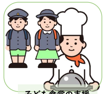
子ども食堂の支援