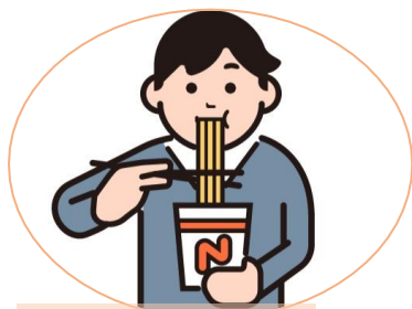
フードバンク事業

今後さらに増加が予想される生活困窮世帯への支援事業として、新たな事業展開も計画しておりますが、本会の財源だけでは十分に支援できない状況にあることから、皆様のご協力を賜りますようお願いいたします。