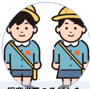
困窮世帯の子どもを 対象としたイベント