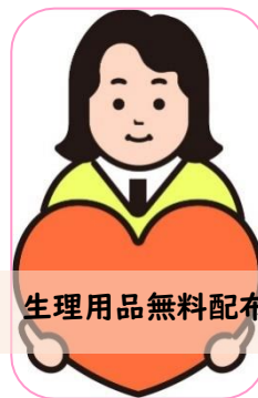
生理用品無料配布