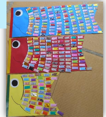
↑ 保育園に贈呈した鯉のぼり