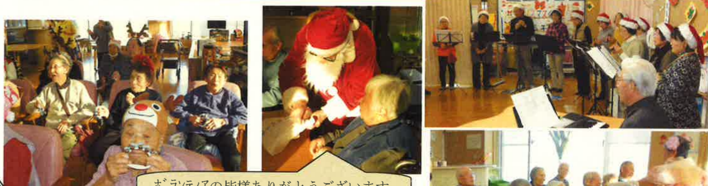
ボランティアの皆様ありがとうございます