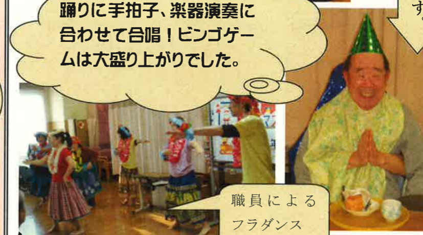
職員によるフラダンス