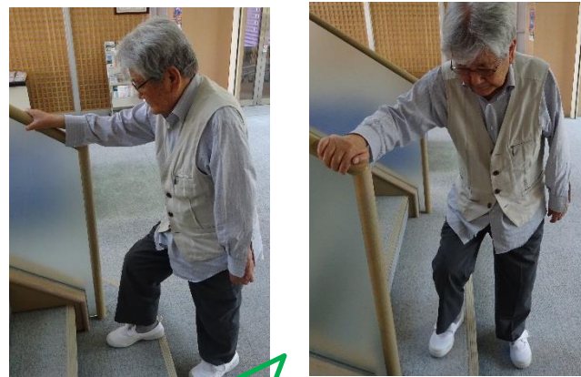
機能訓練では自宅の段差を想定し段差昇降訓練を行います♪

・ふれあいポイントカードですが、毎月26日は“風呂の日”とし、ポイント2倍デーとさせて頂く事となりました。ポイント2倍日は、誕生日、15日、26日となります。 ・ふれあいをご利用中の7割の方が約2年間、介護度の維持や改善をしていることが分かりました。今後もふれあいでは運動レクや理学療法士による機能訓練を継続していきます。機能訓練をご希望の方は職員やケアマネジャーさんにお知らせ下さい。