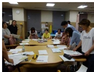
緊急時対応シミュレーションを職員間で行い、ご利用者さんの急変や緊急時に備えています。

※悪天候や、ご利用者の状況により、送迎時間が前後する場合があります。 ※紛失防止のため、衣類や持ち物には全て記名していただきますようお願いいたします。 ※特別な事情のない限り、多額の現金、飲食物の持ち込みはご遠慮下さい。