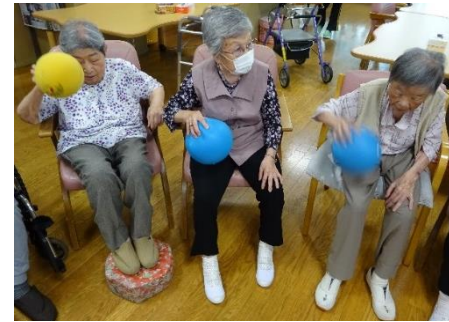
ボールや指先を使った運動レクも元気に参加して頂いています♪