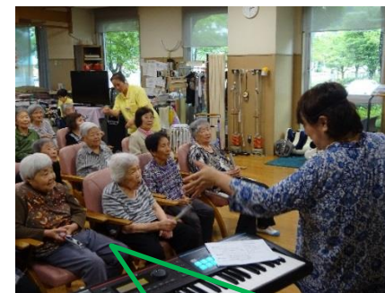
森先生の音楽療法も月に2回実施させて頂いています♪