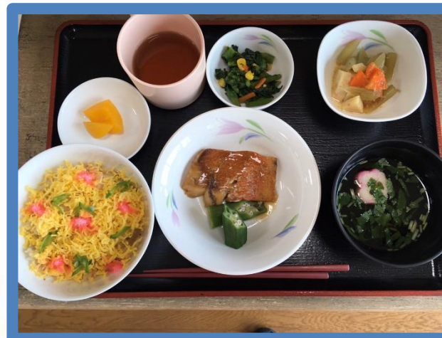
【3/3日のひな祭りメニュー】

新型コロナウイルス感染予防のため、3月に続き4月に予定していました音楽療法、各ボランティアさんの行事は 中止 とさせていただきます。