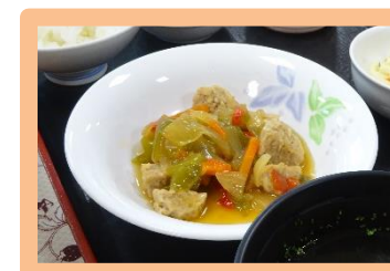
②肉団子の野菜あんかけ