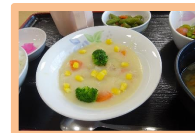
クリームシチュー