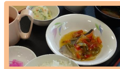
①鮭の野菜あんかけ