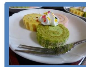
おやつは可愛いひな祭りケーキでした♪