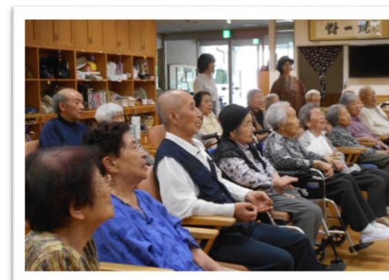
一緒に「ふるさと」を大合唱♪