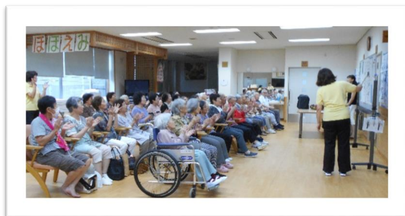
8月31日ほほえみ参観日