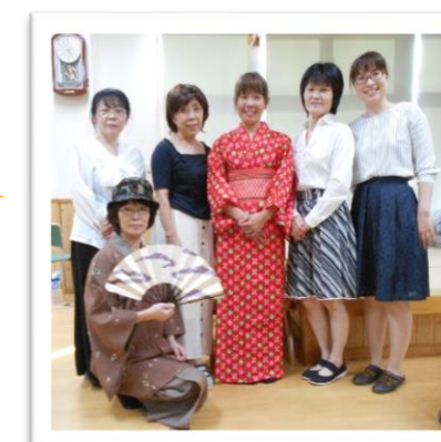
家族写真！？いえいえ職員です。