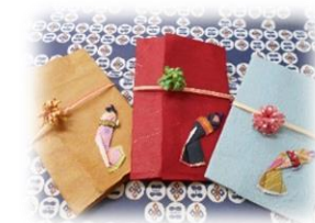
一言そえた写真をプレゼント♪