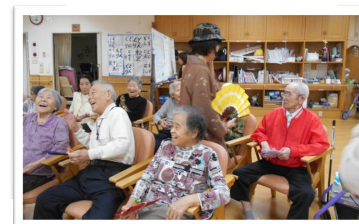
職員の私服姿に大爆笑？？

9月17・18日は『敬老会』を行いました。まずは、普段見られない職員の私服姿(仮装??)お披露目で笑っていただき、懐かしの歌「上をむいて歩こう」「ここに幸あり」を皆さまと一緒に合唱しました。最後は「ふるさと」をハンドベルでしっとりと。楽しい時間を過ごしていただきました。