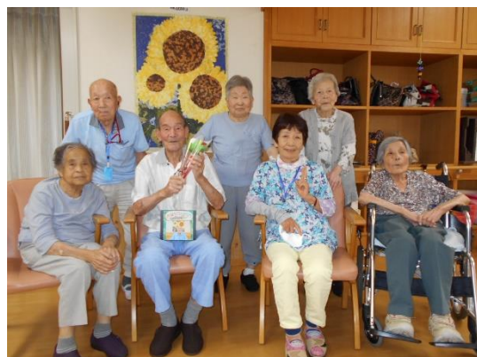
同じ地区のみなさんと