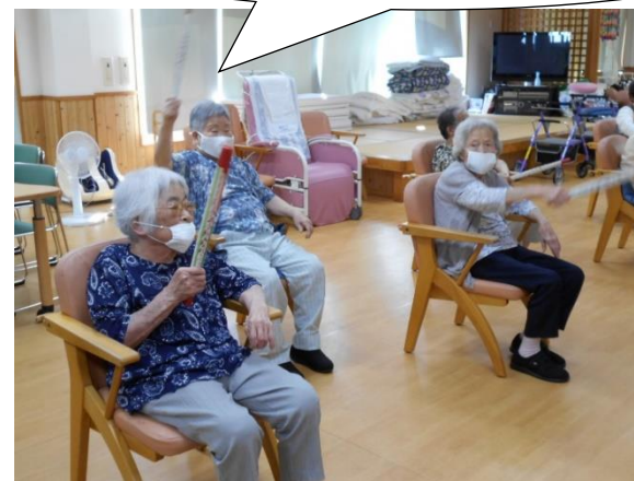
↑「古城」に合わせてストレッチ体操