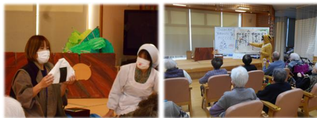
↑ 昨年のクリスマス会の様子

豪華な食事や、お楽しみ抽選会等のゲームで盛り上がりましょう！！ 毎年恒例の、職員の劇も計画しています。お楽しみに！