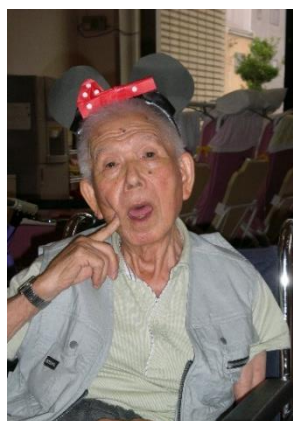
ミニちゃんもお祝いに！