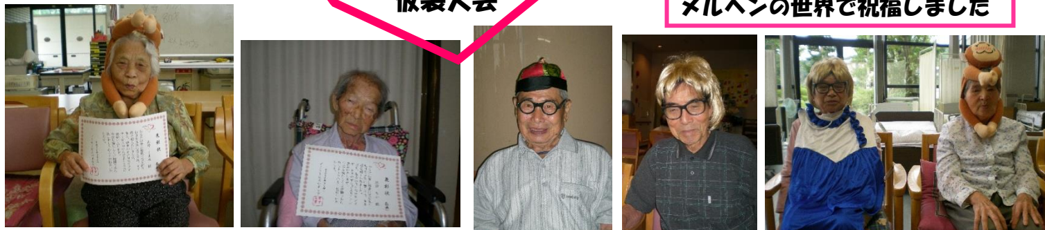
メルヘンの世界で祝福しました