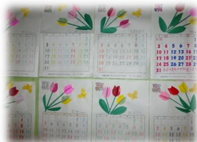
フロアはすっかり春です♡