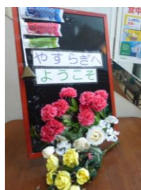
ウエルカムボードでお迎え