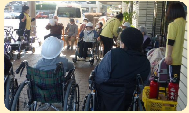
↑震度3程度の地震による厨房からの出火を想定し利用者の避難訓練を行いました