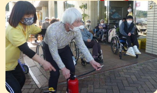
↑消火活動体験も実施!