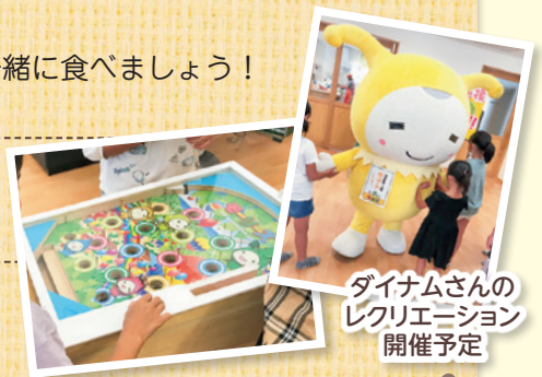
ダイナムさんのレクリエーション開催予定