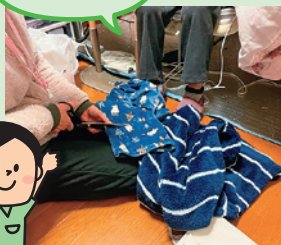
ズボンのすそ直し