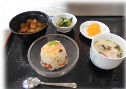
ちらし寿司に鍋とごちそうができました