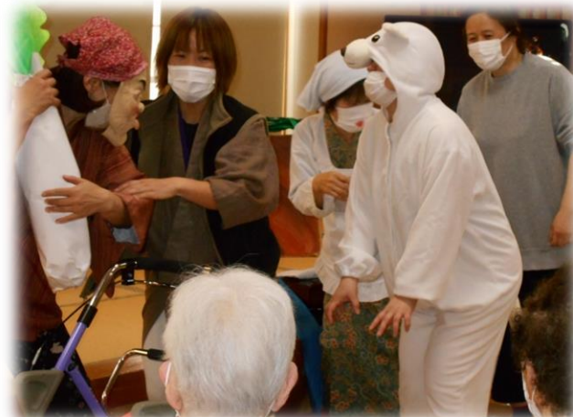
職員の劇「おおきなかぶ」