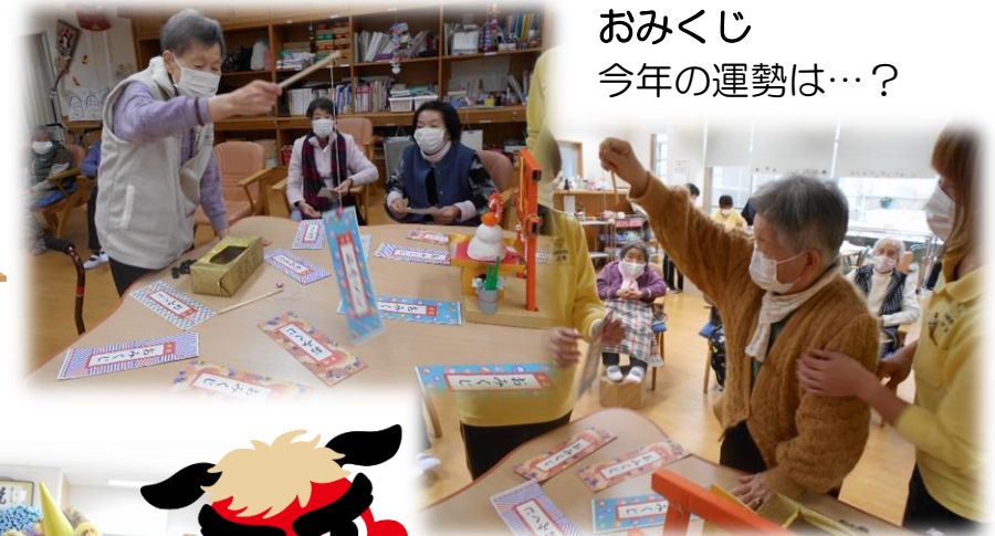
おみくじ 今年の運勢は…?