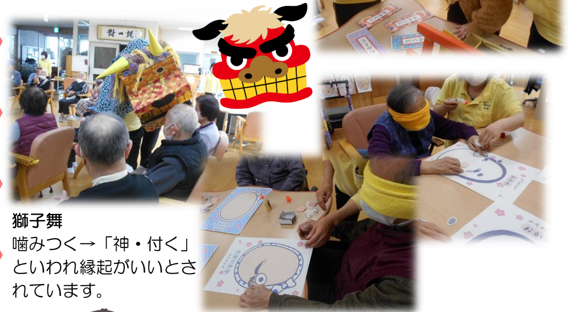
獅子舞 噛みつく→「神・付く」 といわれ縁起がいいとされています。