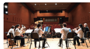
地域交流・共生ハーモニーコンサート